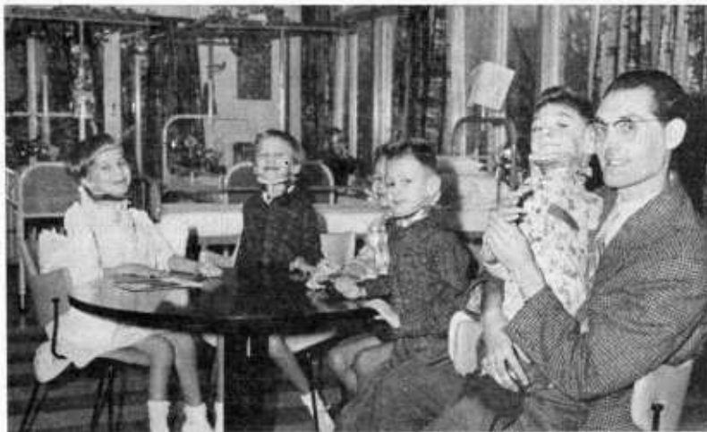
Heel, heel hartelijk dank!

Wij verlenen gaarne plaats aan een brief, die wij mochten ontvangen, naar aanleiding van het ten geschenke gegeven televisietoestel.