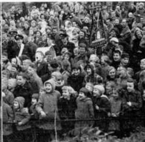
Vrolijk klinken de liedjes over het Rondoplein

Het St. Nicolaasfeest is ook dit jaar op vele plaatsen in ons land op uitbundige wijze gevierd. Vol verwachting over wat er in hun schoentje zou zitten klopten duizenden kinderhartjes en enigszins bevreesd hebben ze op de avond van 5 december het grote ogenblik, het uitdelen van geschenken, afgewacht.