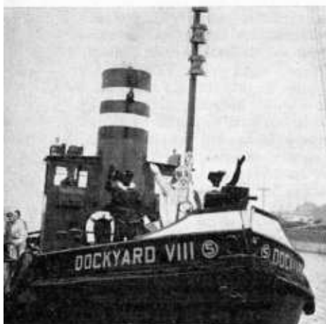
St. Nicolaas arriveert aan de Waalhavenponton