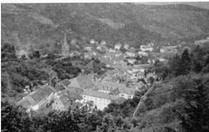
GEZICHT OP ECHTERNACH