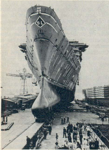
Fig. 1. Sea-Land Finance

Two more SL-7 class containerships are undergoing final outfitting in German yards prior to entering service for Sea-Land in August and September.