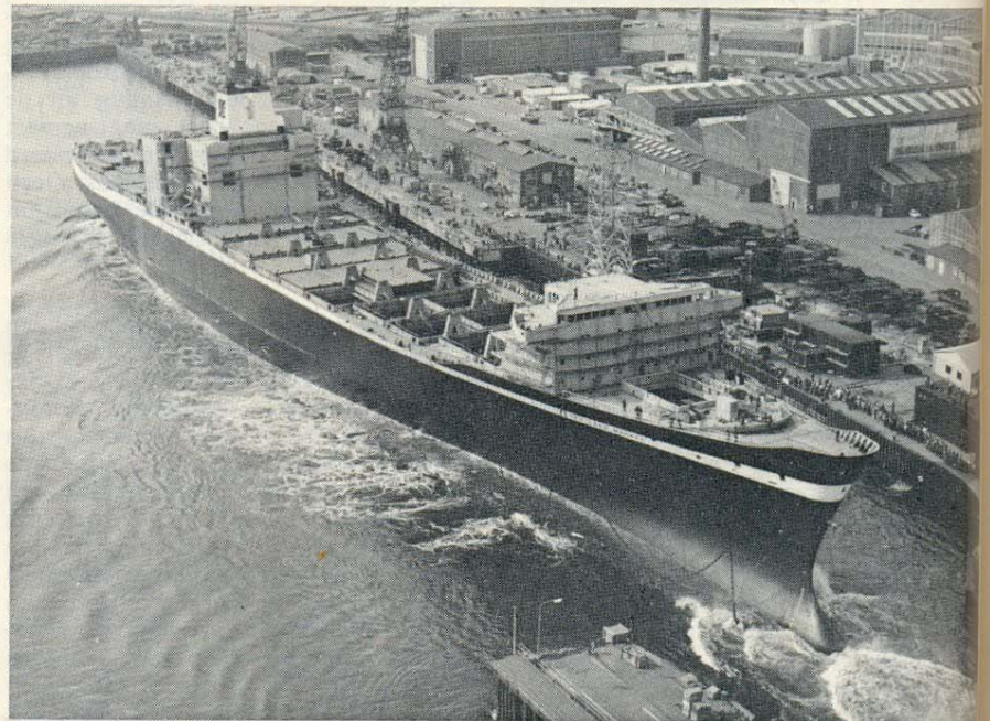
Fig. 2. Sea-Land Market

The Atlantic service offers weekly sailing from Rotterdam and Bremerhaven and New York, while the Pacific service offers weekly service between the U.S. West Coast and Japan.