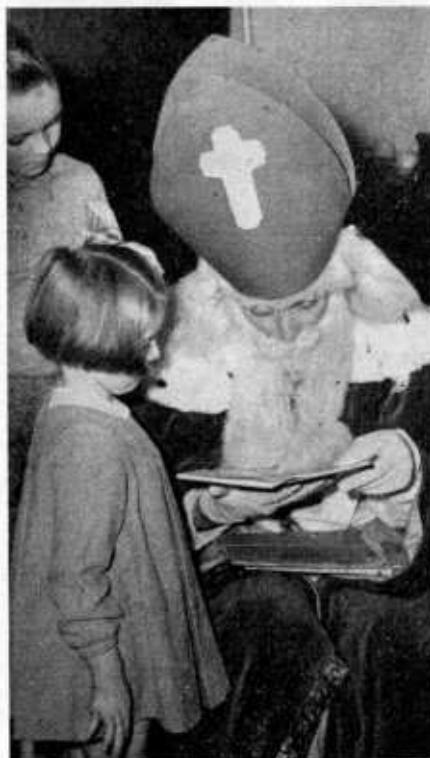
Vol verwachting klopt haar hart

Mocht iemand in het bezit daarvan zijn, dan zal de redactie van De Wekker het op prijs stellen te horen wie dit is. Red