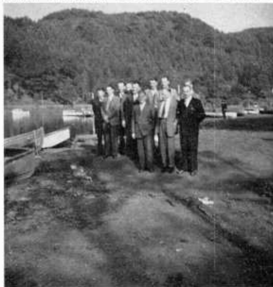
Aan de oever van Loch Lomond.

Het is moeilijk in een kort verslag een indruk te geven van het prachtige land en zijn tradities, zoals dit door de gidsen in de autobussen werd gedaan. De Schotse Hooglanden, bergen, heuvels en meren in