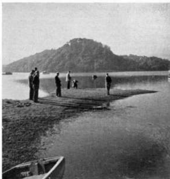
Aan de oever van Loch Lomond.

Het prachtige herfstweer heeft er toe bijgedragen dat deze tocht zo goed geslaagd is en, hoewel enigszins vermoeid, was iedereen voldaan over hetgeen dit land te bieden had en er dankbaar voor, in de gelegenheid